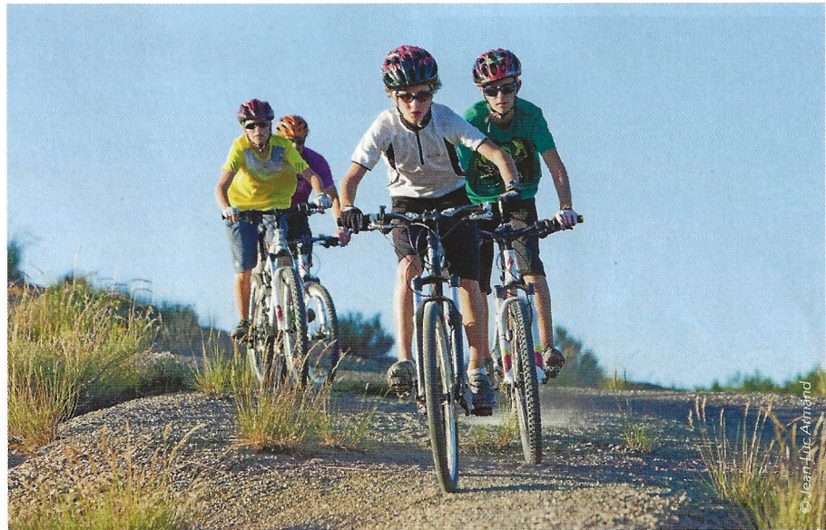
Ne pas hésiter à varier les terrains de jeux.

Du point de vue physiologique, chaque enfant possède initialement un capital de fibres musculaires indifférenciées qui évolueront plus tard en fibres rapides, intermédiaires ou lentes. Ces sollicitations explosives vont lui permettre de se constituer un patrimoine de fibres rapides et intermédiaires-rapides. Cette qualité de fibres sera la base de ses futures qualités musculaires et tendineuses. Par contre, lors de sollicitations modérées et plus en durée, il constituera un stock de fibres lentes intéressantes pour les activités d'endurance. Mais il n'y a pas d'urgence pour ces fibres lentes, bien au contraire. Rappelons que, une fois que ces fibres indifférenciées (à l'origine) se sont plus ou moins spécialisées, il leur sera difficile de revenir en arrière. Pour être plus précis : transformer rapides en intermédiaires puis éventuellement en lentes sera toujours possible, mais dans l'autre sens, c'est pratiquement impossible. Autrement dit, si nous