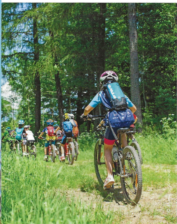
L'École française de vélo, un lieu idéal pour explorer le monde et développer son capital santé.

Nous n'entrerons pas dans le détail de ce mécanisme mais retenons que cette capacité à produire ce niveau d'énergie pour nous déplacer est une qualité essentielle et mesurable pour évaluer notre niveau de performance et notre capital santé. Cette filière pour produire de l'énergie est sollicitée à chaque fois que l'enfant réalise des efforts courts (entre vingt secondes et deux minutes) à intensité soutenue. Inutile de préciser qu'il sera nécessaire de lui ménager des temps de récupération entre deux secousses. Spontanément il se les ménagera lui-même.